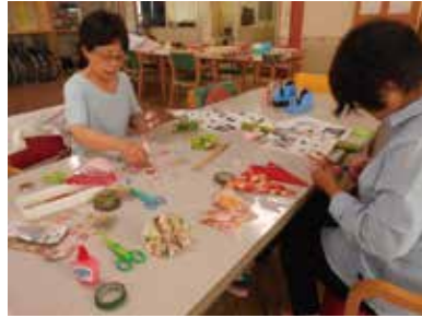
楽しくコサージュ作り