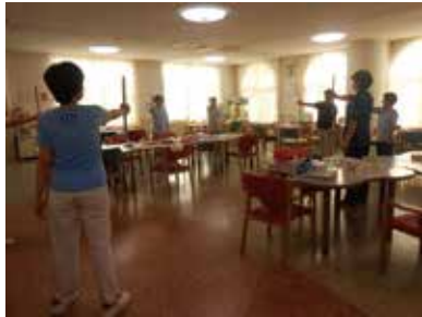
理学療法士による棒体操